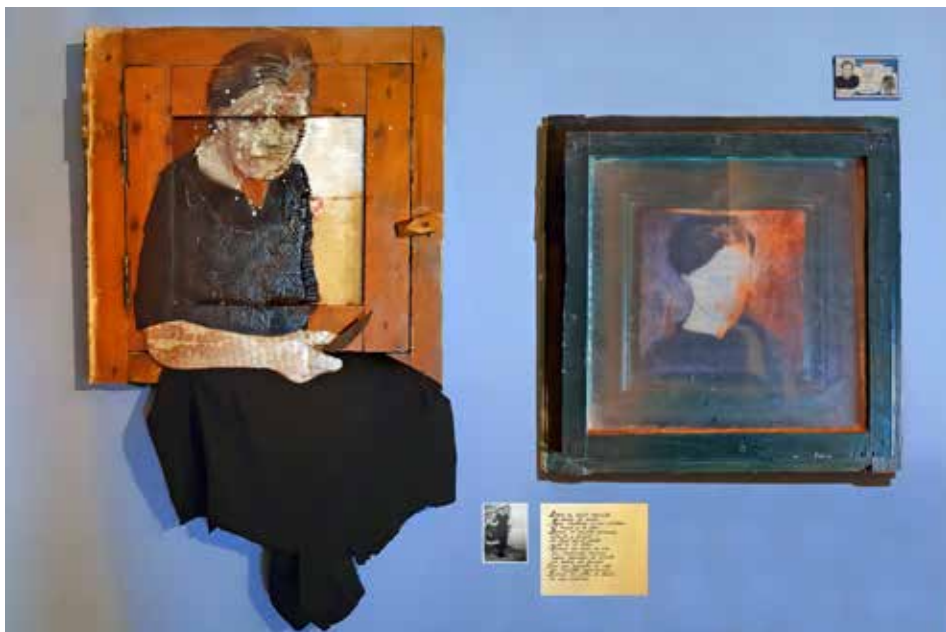
L'OBLIT QUE SEREM. 2020. Collatge i tècnica mixta s/finestral de porta vella.