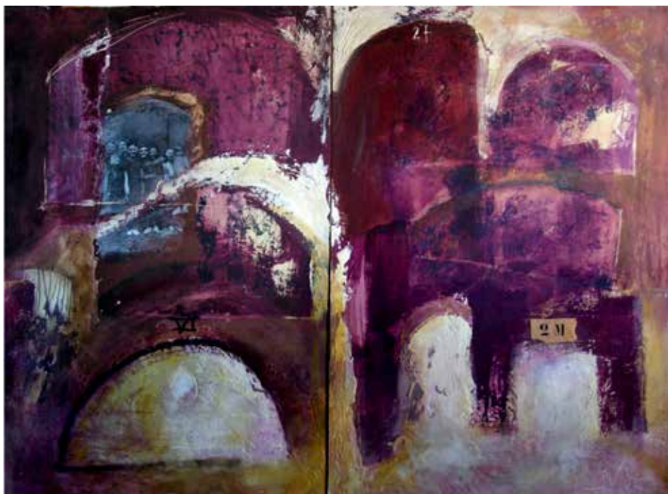
NÍNXOLS. 2000. (130x80 cm). Transferències i Acrílic s/taulell de fusta.