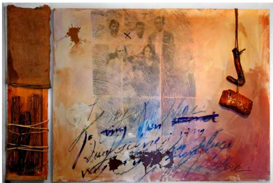
IN MEMORIAM. 1999. (D'íptic 130 x 200 cm). Tècnica mixta i objectes)