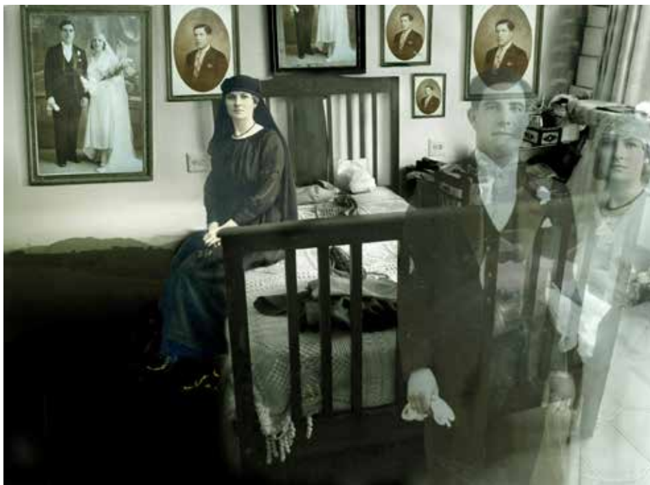
VIDUA. 2011. (47x65 cm). Trucatge Fotogràfic. Impressió stela.