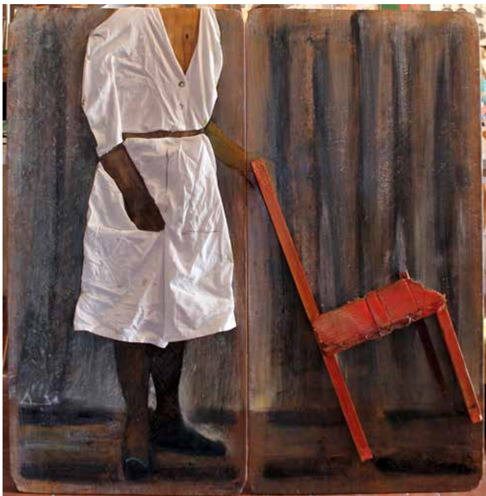
LA PRIMERA EN ANAR-SE'N. 2019. (120x120 cm). Collatge i tècnica mixta s'taules de pa.