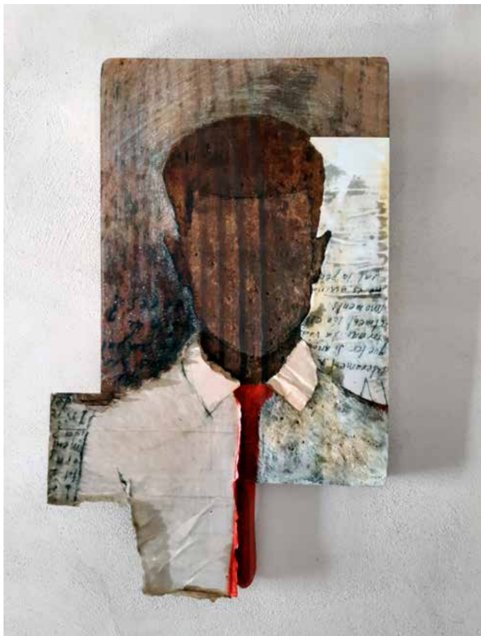
RECORDS D'ALGER. 2021. Collatge i tècnica mixta s/banquet de joier.