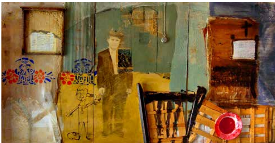
LA CASA DEL MEU AVI. 1999. (116x220 cm). Collatge i tècnica mixta sfusta.