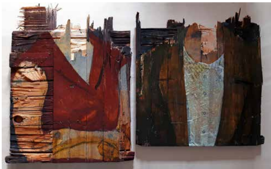
MATRIMONI OBLIDAT. 2021. (61x100 cm) Collatge i tècnica mixta sfusta vella .