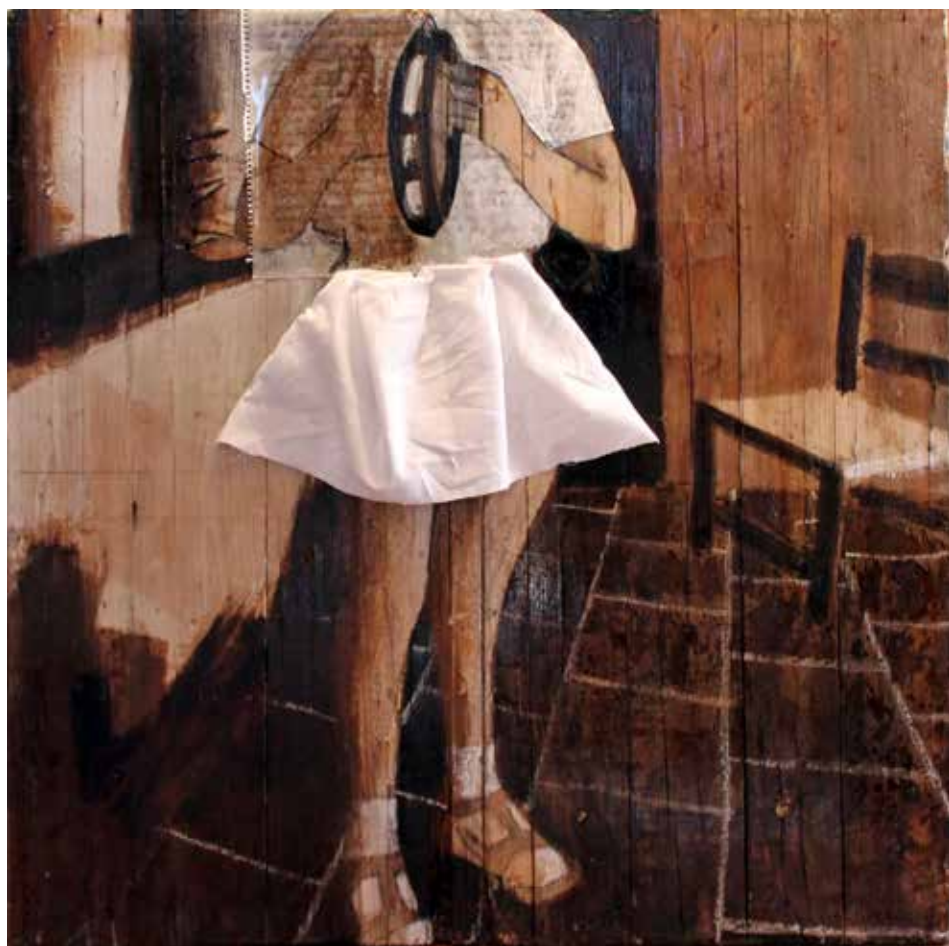
QUAN ENCARA NO ET CONEIXA. 2019. (100 x 100 cm) Collatge i tècnica mixta s/finestra vella.