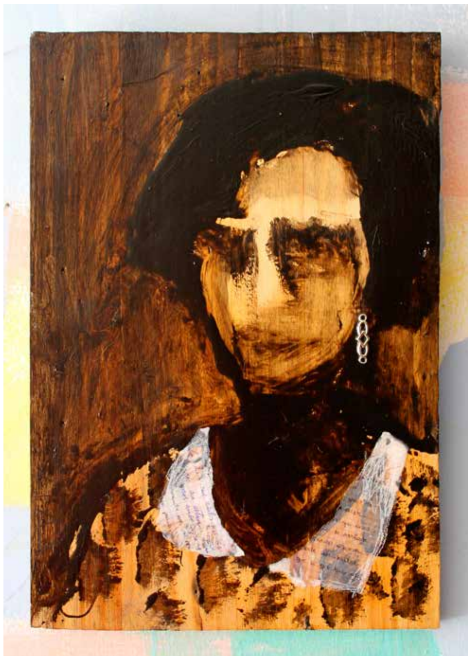
TIA AMB BATA. 2017. (50x34 cm). Collatge i tècnica mixa sfusta vella .