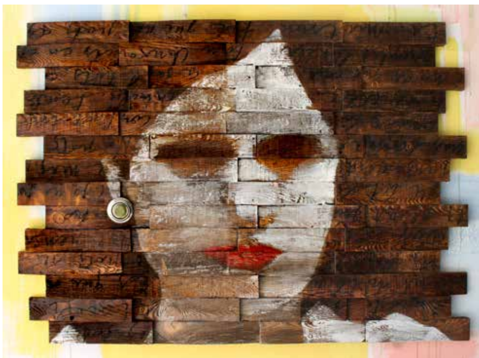
ADELIA 1956. 2021. (84x117 cm). Collatge i tècnica mixta sfusta.