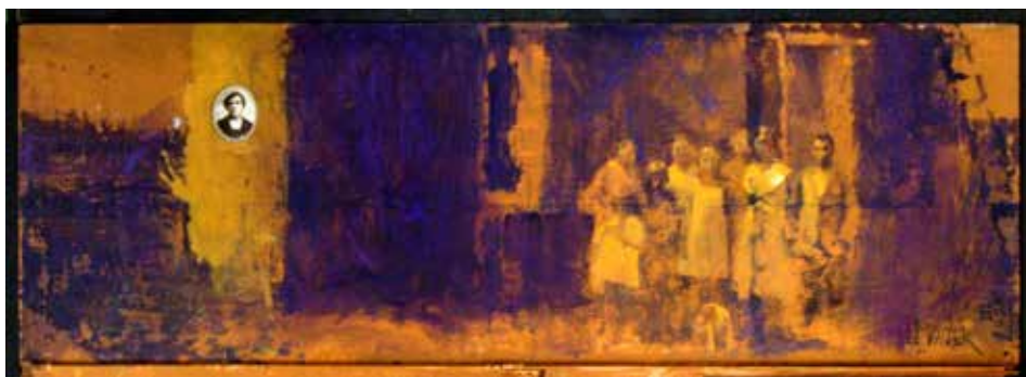
QUÈ ENS QUEDA? 2000. (53x149 cm). Tècnica mixta s/porta vella.