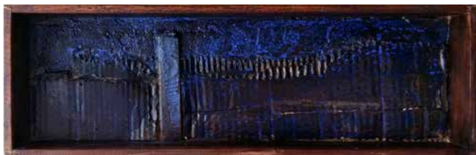
NIT. 2007. (16x50 cm). Collatge i tècnica mixta s/fusta vella.