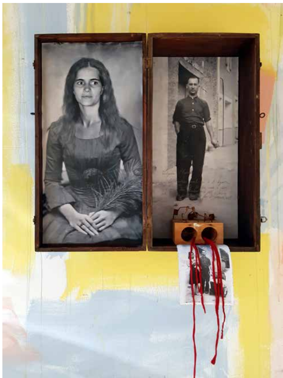
FILS DE SANG. 2022. (66x68x15 cm). Trucatge fotogràfic s/ Maleta.