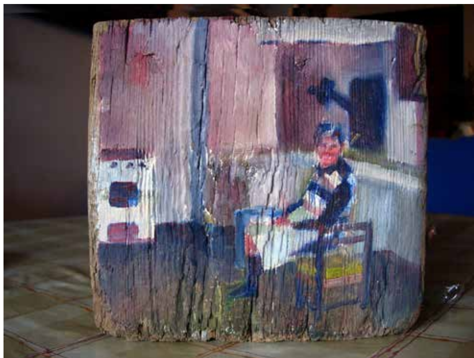
JUANITA LA BLANCA. 1996. (17x18x7 cm). Oli s/fragment de biga.