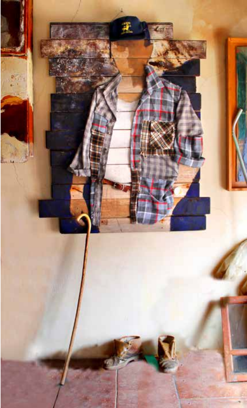
MON PARE. 2020. (186x94 cm). Collatge i tècnica mixta.