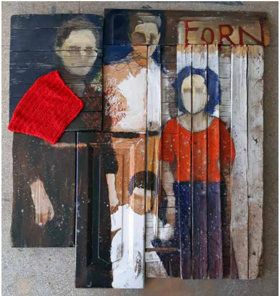
ELS FORNERS DEL CARRERÓ. 2021. (121x112 cm). Collatge i tècnica mixta sfusta vella .