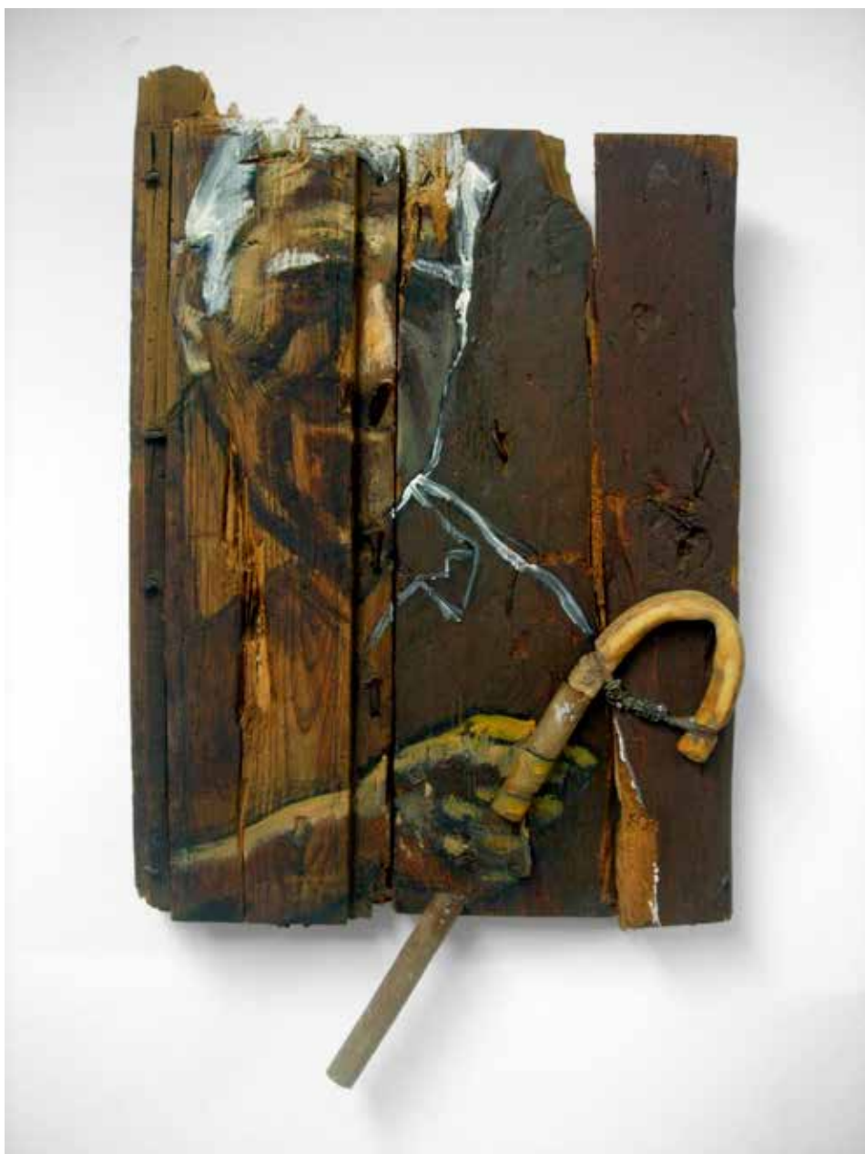
RETRAT AMB GAIATO. 2007. Collatge i tècnica mixta sfusta de porta vella.