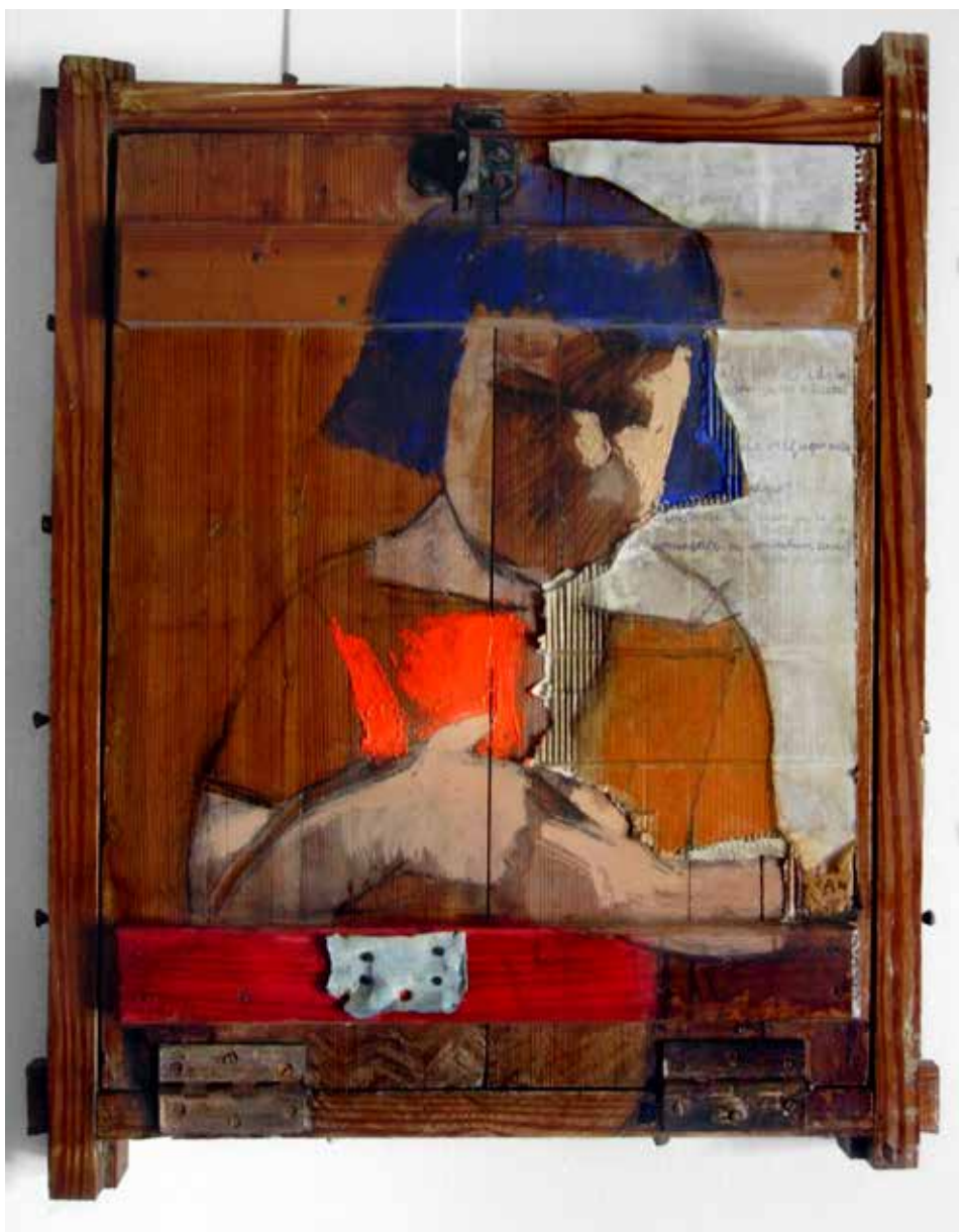
RECORD D'UN CABÀS. 2006. Collatge i tècnica mixta s/finestra vella.