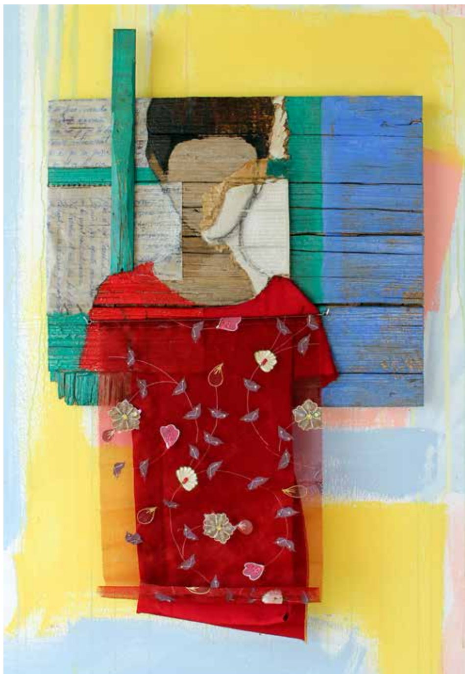
LA SAMARRETA. 2019. Collatge de paper i cortina, tècnica mixta s/fusta vella.