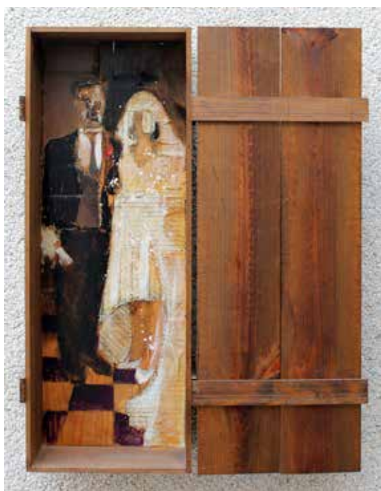
LA GABIETA. 2003. (82x64 cm). Collatge i tècnica mixta s/caixa de fusta.