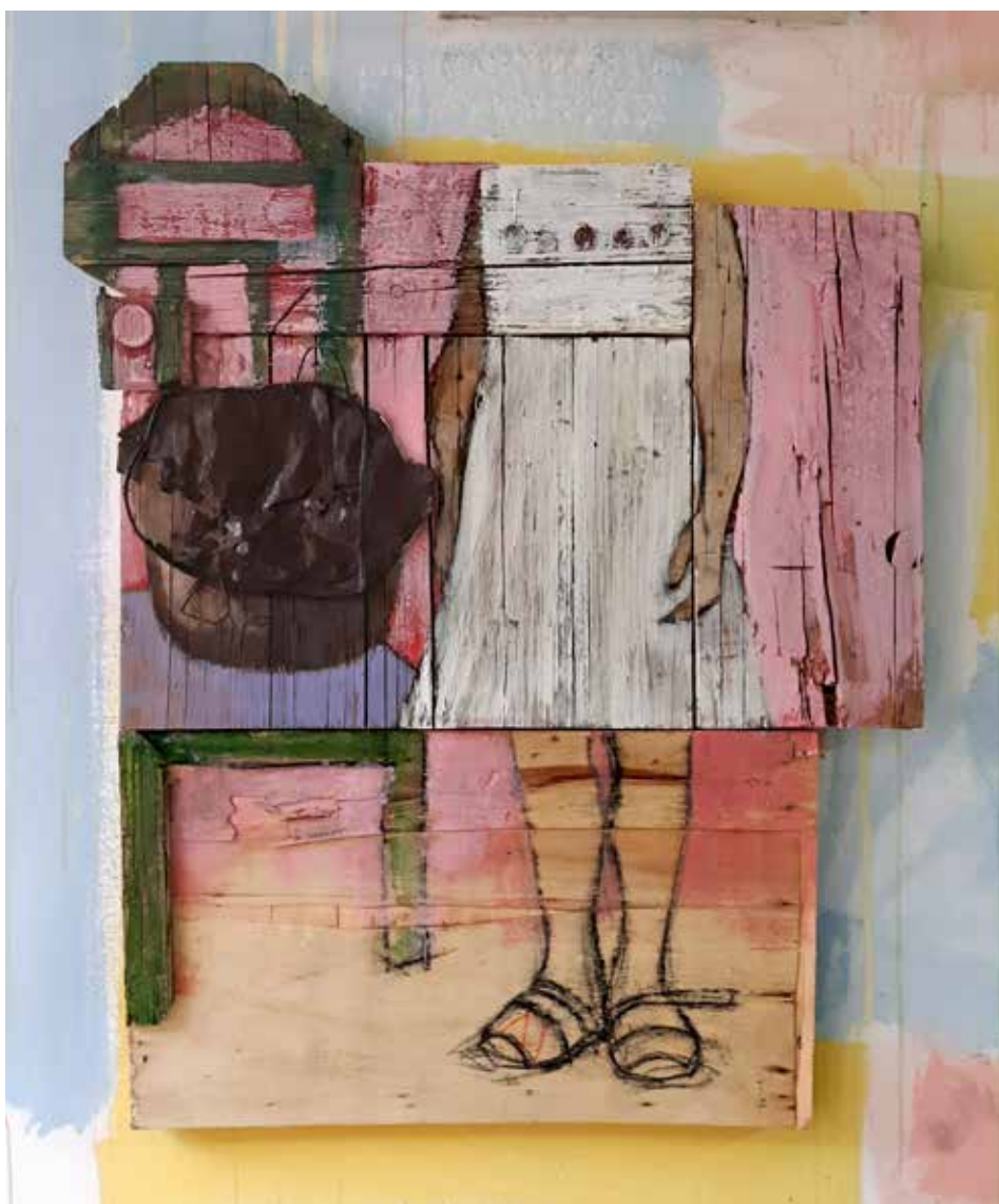
DILLUNS. 2021. (95x76 cm) Collatge i tècnica mixta s/fusta vella.