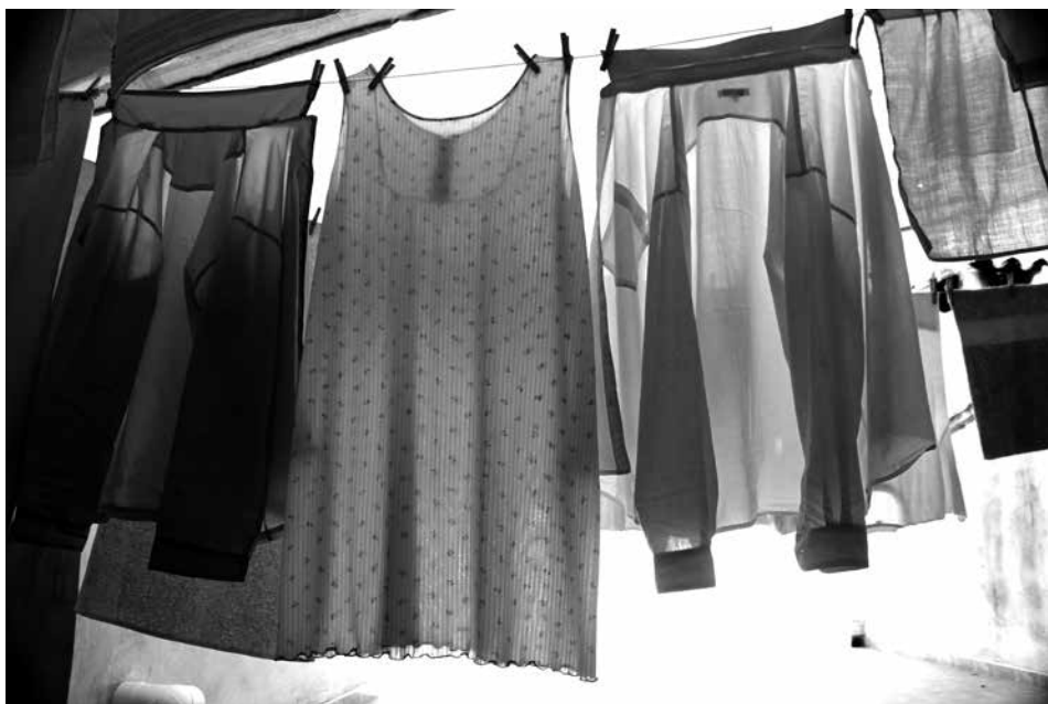
ROBA ESTES, ALLÒ QUE ES QUEDA. 2013. Impressió s/tela.